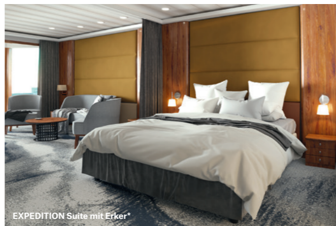
*Illustrierte Darstellung. Das endgültige Design kann abweichen.